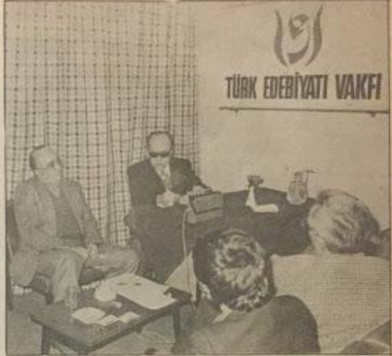
Cemil Meriç vakfımızda sohbeti sırasında